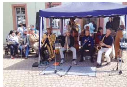
Aus dem Vereinsleben