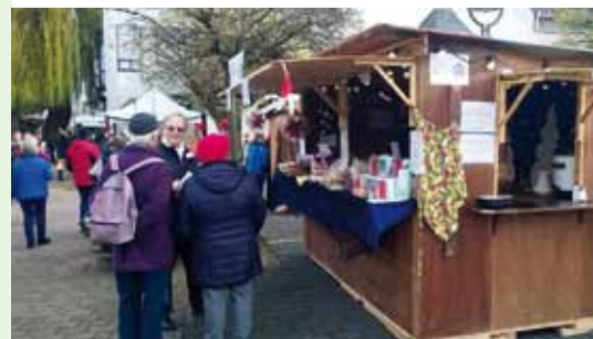
Besucher und Alfred Anlauf

Herr Teufl, Sie organisieren den Stand der SNH am Hofheimer Adventsmarkt bereits zum 4. Mal. Lassen Sie doch die Leserinnen und Leser an der Vorbereitung und Durchführung teilnehmen.