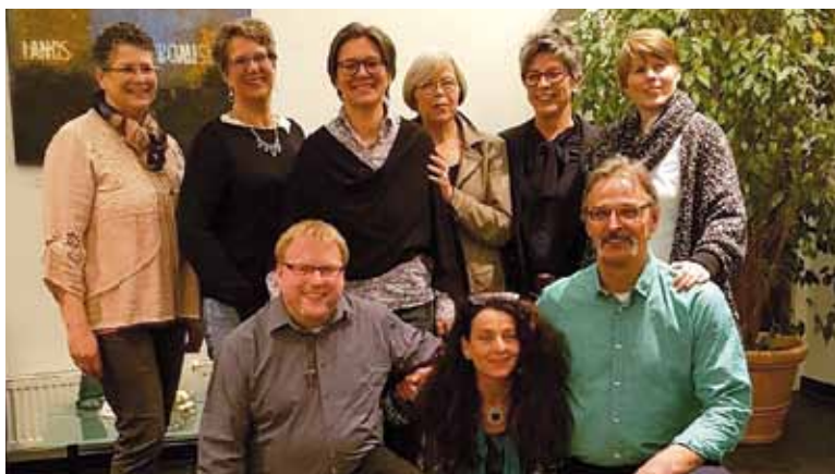
Im Frühjahr 2017 starteten wieder neue Hospizhelfer/-innen in das Ehrenamt.